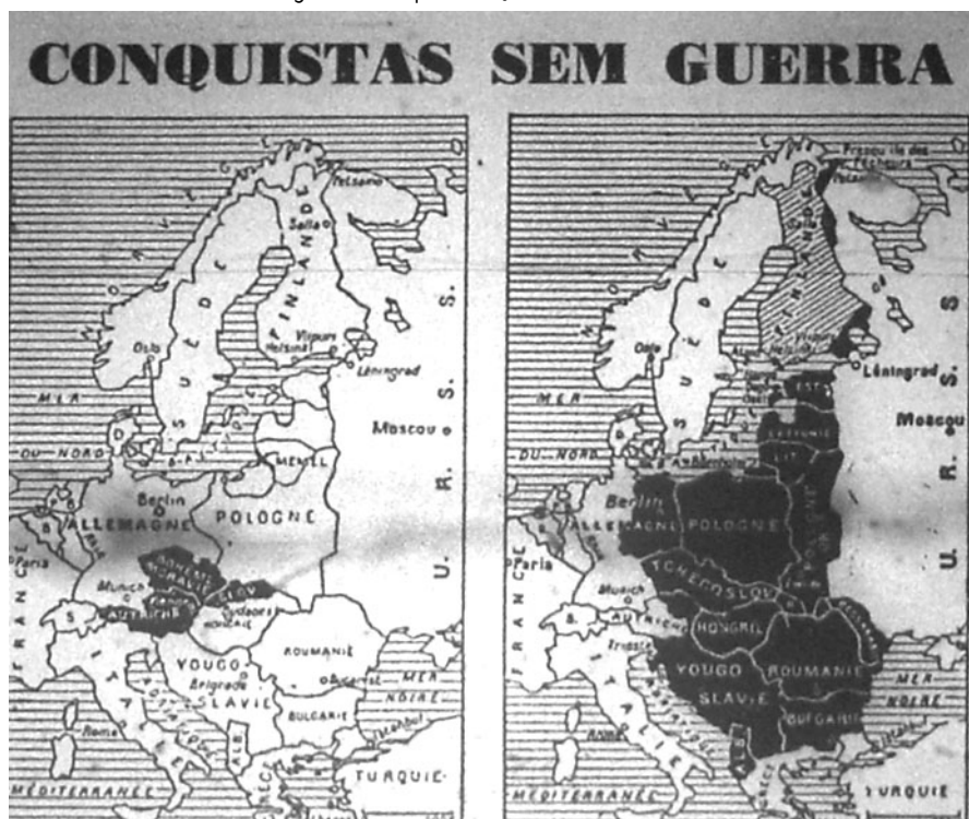
Figura 3 – Mapa: CONQUISTAS SEM GUERRA

mapas 9 para demonstrar o processo de conquistas empreendido pelos soviéticos: