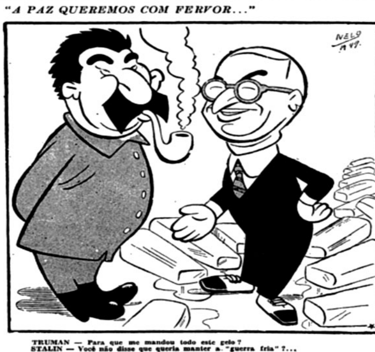
Figura 4 – Charge: “A PAZ QUEREMOS COM FERVOR”